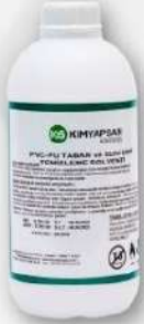
● PLASTİK ŞİŞE