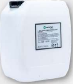
● PLASTİK KOVA