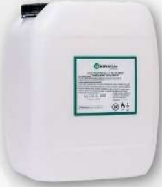
● PLASTİK KOVA