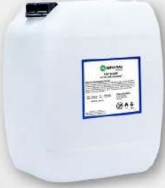
● PLASTİK KOVA