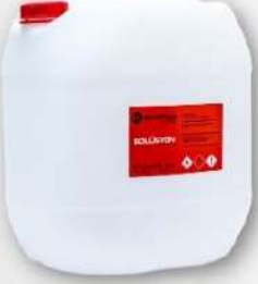
● PLASTİK KOVA