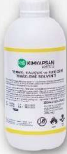
● PLASTİK ŞİŞE