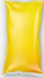
● HOTMELT - PILLOW