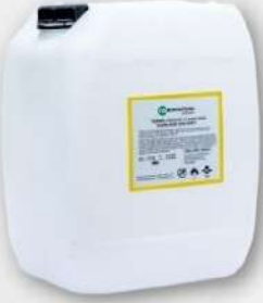
● PLASTİK KOVA